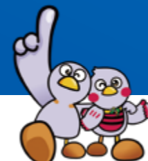
埼玉県のマスコット コバトン & さいたまっちゃん

埼玉県大学生インターンシップ推進事業 埼玉县委託事業 実施推進団体：一般社団法人 埼玉県経営者協会 日本経団連埼玉