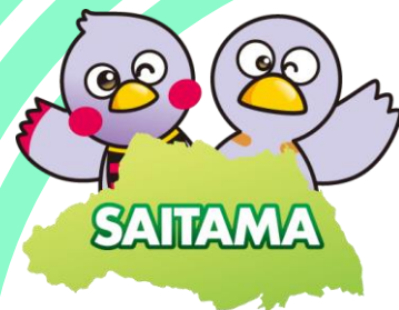
埼玉県マスコット「コバトン」「さいたまっち」

ZoomはZoom Video Communication, Inc.の登録商標です。QRコードは株式会社デンソーウェブの登録商標です。